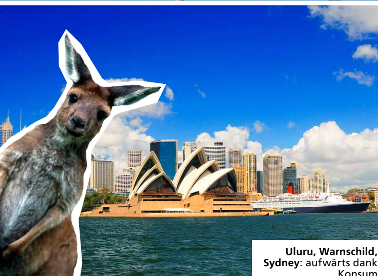
Uluru, Warnschild, Sydney: aufwärts dank Konsum