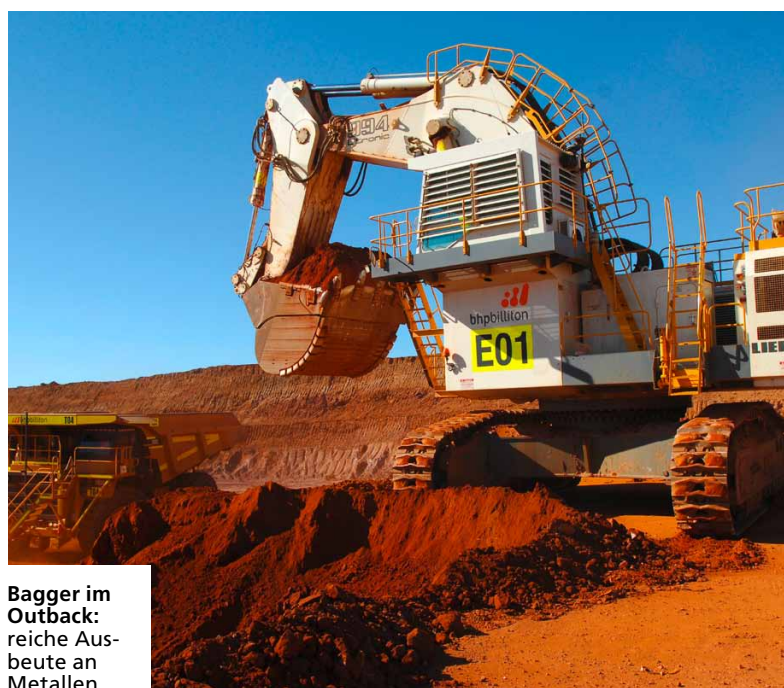
Bagger im Outback: reiche Ausbeute an Metallen

Er geht davon aus, dass die Finanzkrise noch eine Weile dauern wird und auch in Australien demnächst Zinssenkungen zu erwarten seien. „Dies wird den Konsum ankurbeln“, so seine Prognose. Der fünfte Kontinent bietet eben mehr als Naturerlebnisse. ■